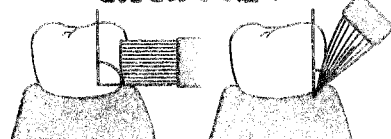
スクラッピング法